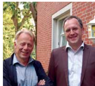
Jürgen Trittin und Dr. Reinhard Loske